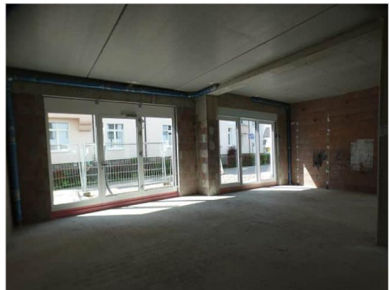
Innenansicht im Rohbau