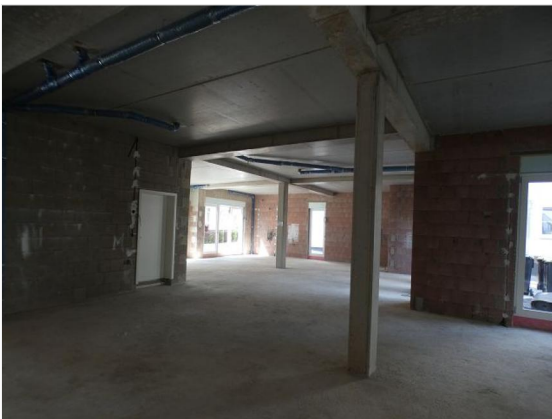
Innenansicht im Rohbau